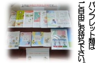
パンフレット類は 10冊単位で返却です。